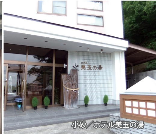
小砂/ホテル美玉の湯