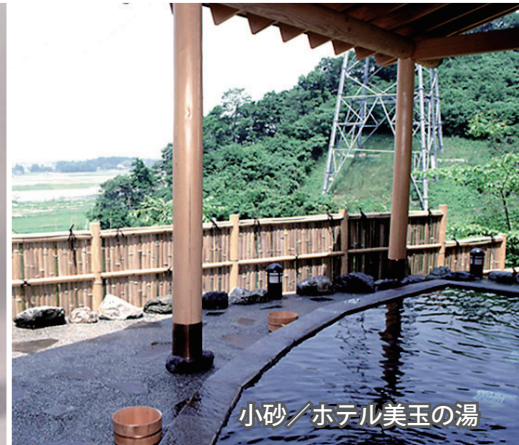
小砂/ホテル美玉の湯